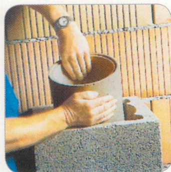
4.5 A samottcsövet behelyezzük és a kinyomódó hézagkittet lesimítjuk.