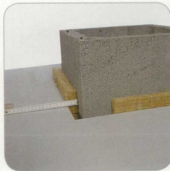
5.1. A födémátvezetésnek minden oldalon 3 cm-rel nagyobbak kell lennie, mint a köpenytégla külső méretei. A közbelső teret nem éghető szigetelő anyaggal kell kitölteni.