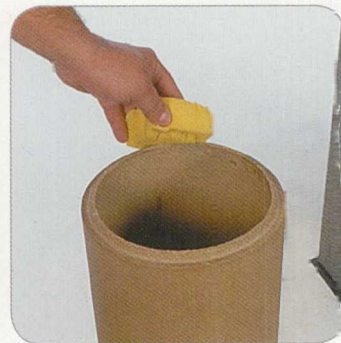
4.3 A következő samottcső mindkét végét megnedvasítjuk.