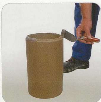
4.4 Hézagkittet hordunk fel a peremére.