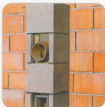
3.6 A következő köpenytéglat a habarcsterítésre helyezzük. Ventilátoros égőknél (blokkégőknél) a kazánházakban robbanási csapóajtót kell elhelyezni.