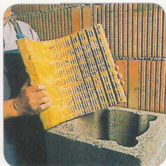
4.2 Mehajlítjuk és behelyezzük a szigetelőlapot.