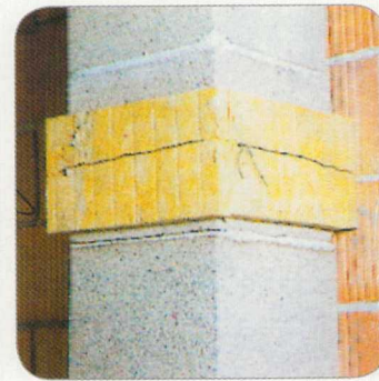
5.2 A födém utólagos betonozásánál a kürtőre minden oldalról rem éghető, legalább 3 cm vastag szigetelőanyagot kell elhelyezni.