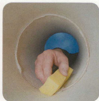
3.5 A kinyomódó hézagkittet elsimítjuk.