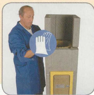
8.3- 8.4 A nyílással ellátott köpenytéglát felhelyezzük. A felesleges habarcsot lehúzzuk, a nyitott felfekvésű hézagokat teljesen eltömítjük. Meghajlítjuk és behelyezzük a szigetelő lapokat. Az előlő szellőztető csatornákat szabadon kell hagyni, ezért a hőszigetelő lapot le kell vágni.