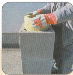
6.2 A szigetelő lapot meghajlítjuk és behelyezzük.