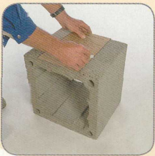
8.1 A köpenytéglára a kivágó sablon segítségével felrajzoljuk a tisztítóajtó nyílását.