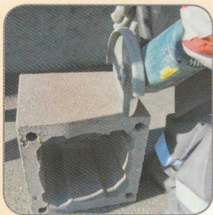
8.2 Sarokcsiszolóval kivágjuk.