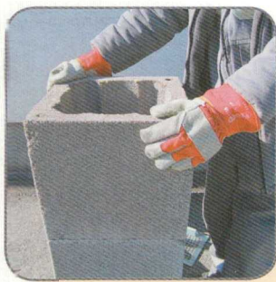
6.1 A köpenytéglát a habarcs-terítésbe helyezzük