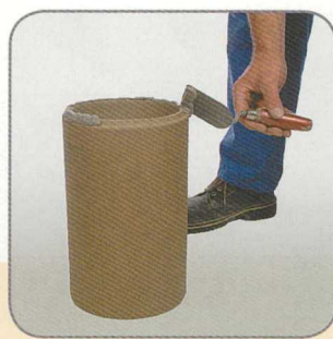
6.3 Hézagkittet hordunk fel a samottcső alsó peremére.