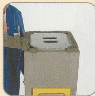
7.4 A habarcs-sablon segítségével habarcsot hordunk fel a kéménytalp tetejére. A sarokfuratokba ne kerüljön habarcs.