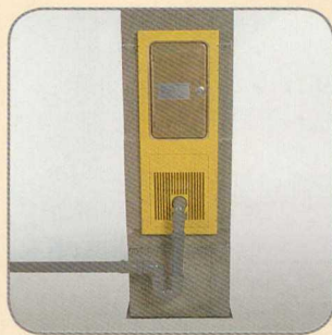
7.3 Kialakítjuk a kondenzvíz elvezetését és a csatornába köttetjük.