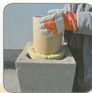
6.4 A samottcsövet behelyezzük és a kinyomódó hézagkittet letöröljük.