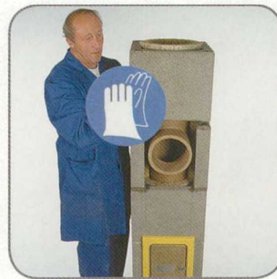
9.7 Az így előre előkészített köpenytéglát felhelyezzük.