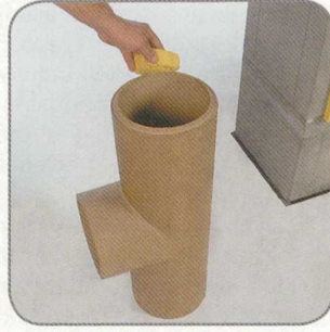
9.2 Megtisztítjuk a füstcső-csatlakozó csővégeit.