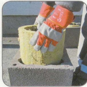
9.6 Meghajlítjuk a szigetelő lapokat, és már előre behelyezzük a következő köpenytégla.