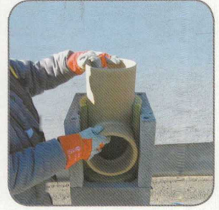
9.4 Behelyezzük a csatlakozót