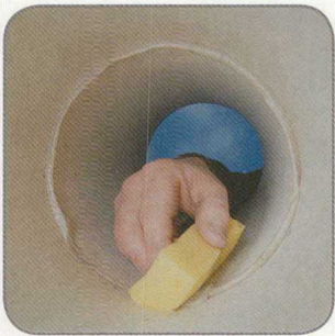
9.5 A nyomódó hézagkittet letöröljük.