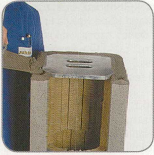
9.1 Habarcsot hordunk fel. A sarokfűratokba ne kerüljön habarcs.